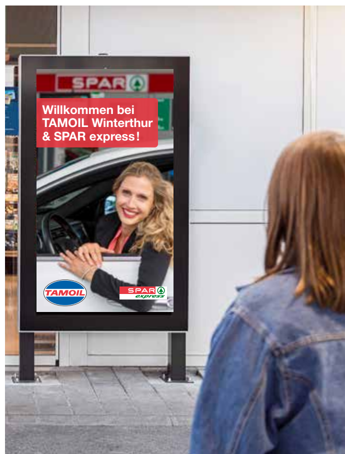
Nouveau visuel de bienvenue diffusé sur les écrans des stations (cityscreen + gasstationTV) avec supermarché SPAR ou SPAR express.