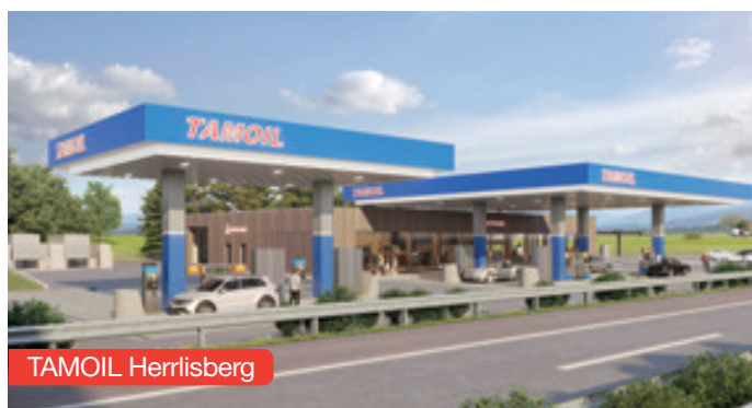
Visualisation: Soriano Architektur GmbH

Sont également en cours 2 gros projets qui nous tiennent tout particulièrement à cœur. En effet, notre réseau accueillera deux nouvelles stations flam-bantes neuves : Sirnach , dans le canton de Thurgovie et la station autoroutière d'Herrlisberg (ZH).